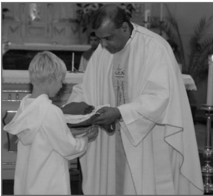
Nächste Mini-Generation: Überreichung des „richtigen“ Gewandes

Das wichtigste steht ganz am Beginn. Zum Zeichen der Aufnahme wird den neuen Minis ihr „richtiges Gewand“ überreicht. Einige Wochen durften sie schon „schnuppern“, dabei haben sie noch ein rein weißes Gewand getragen, doch ab jetzt tragen sie wie die anderen grüne, rote oder violette Kutten und Krägen.