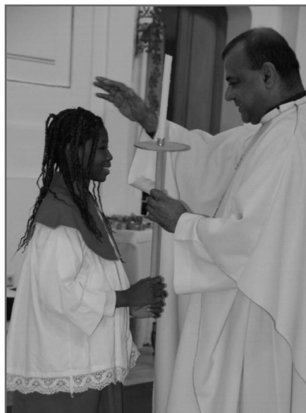
Neu im Amt als Fackelträgerin

Auch die übrigen Minis werden für ihre Leistungen im Laufe des Jahres „vor den Vorhang“ geholt und in den Tätigkeiten bestätigt, die sie neu erlernt haben: Da geht es um das Tragen der Fackeln beim Hochamt, um Wein und Wasser als Symbole für die Gabenbereitung und um die Leuchter, die Geräte der Akolythen – Begleiter des Priesters, vor allem beim Evangelium. Alle Symbole werden während der Feier zum Zeichen der Sendung in den neuen Dienst kurz symbolisch überreicht.