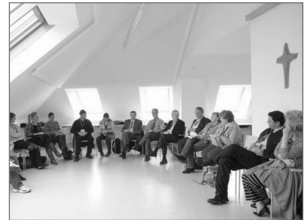
Diözesanversammlung 2010 - Wir Christen werden Veränderungen zulassen müssen