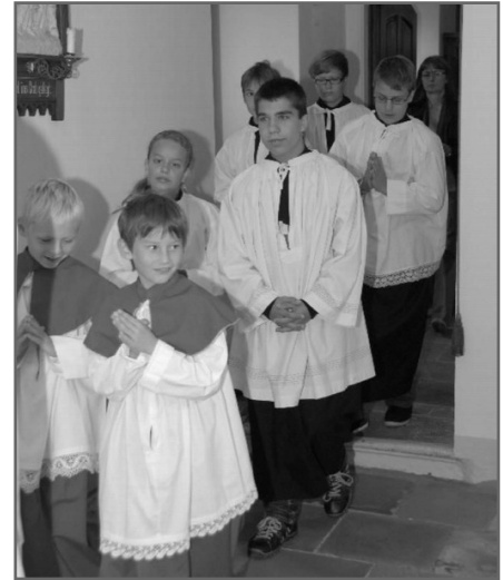
Zum ersten Mal in den neuen Gewändern